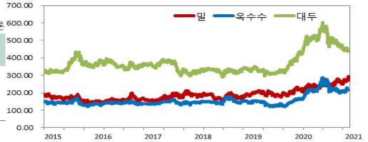
주1. 시카고선물거래소에서 거래되는 밀(적색연질밀; SRW), 옥수수, 대두의 근월물 (밀 : 12월, 옥수수 : 12월, 대두 : 1월물) 정산가격임.