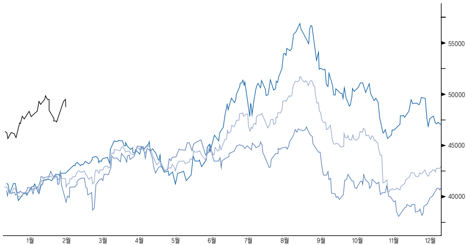
주: 좌측 그래프 2013년 3월말 대두 가격, 우측 상단 그래프부터 2012년 대두 가격, [2008-2012] 평균 대두 가격, 2011년 대두가격

잠재적인 가격 변수인 파종 전망 및 날씨 변수를 제외하고 단기적으로 대두 가격에 영향을 미칠만한 이슈는 브라질 항구 파업 및 선적 지연 관련 이슈로 판단된다. 이미 역대 최대 규모의 대두 집결량을 보이고 있는 브라질에서 발생한 항만 노동자 파업 이슈는 단기적으로 대두가격에 가장 큰 영향을 줄 것으로 예상된다. 현재 최대 8,300만 톤에 달하는 수확량 전망과 항구로 집결되고 있는 물량을 현 물류시스템 하에서 완벽하게 소화하지 못하고 있는 상황에서 브라질 정부의 민영화를 통한 항만의 현대화를 추진할 계획에 반대 일환으로 발생한 이번 파업사태는 국제 시장내 대두 수급상황을 더욱 악화시킬 가능성이 높은 것으로 판단된다.