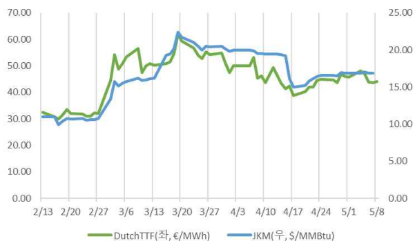
『'26년 2월~5월 국제 천연가스 가격 추이』