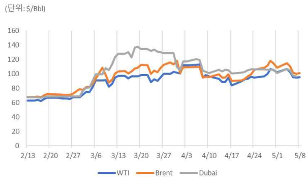
『'26년 2월~5월 국제유가 추이』