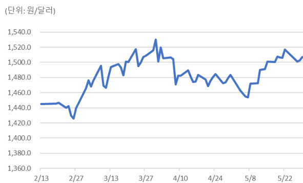
『'26년 2월~5월 원/달러 환율 추이』