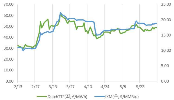
『'26년 2월~6월 국제 천연가스 가격 추이』