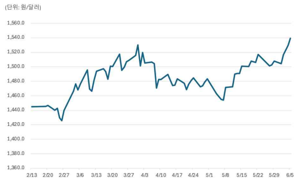
『'26년 2월~6월 원/달러 환율 추이』