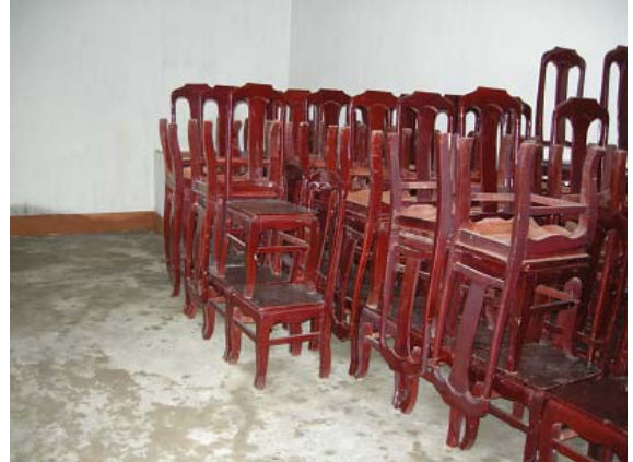
그림 22 마을회관 지원-의자 등 집기