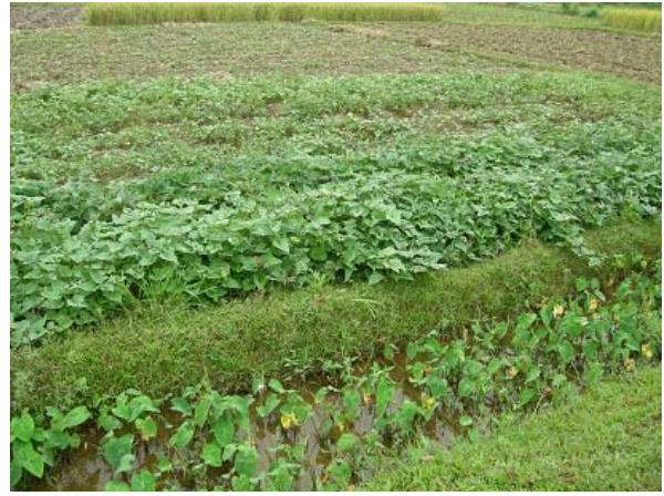
그림 2 소득개발 지원-감자