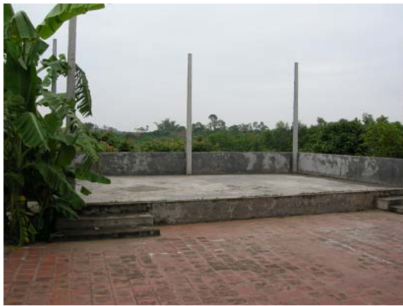
그림 9 마을회관 지원-야외무대