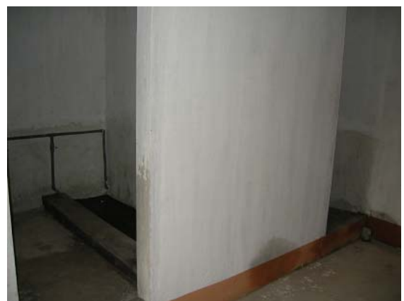
그림 20 마을회관 지원-화장실