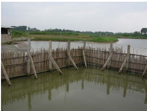
그림 5 소득개발 지원-축사, 과수원, 양식장 복합단지