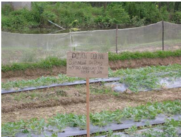
그림 3 소득개발 지원-수박