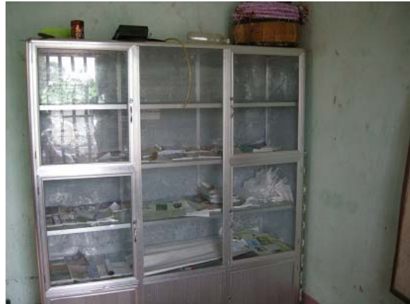
그림 8 마을회관 지원-캐비닛