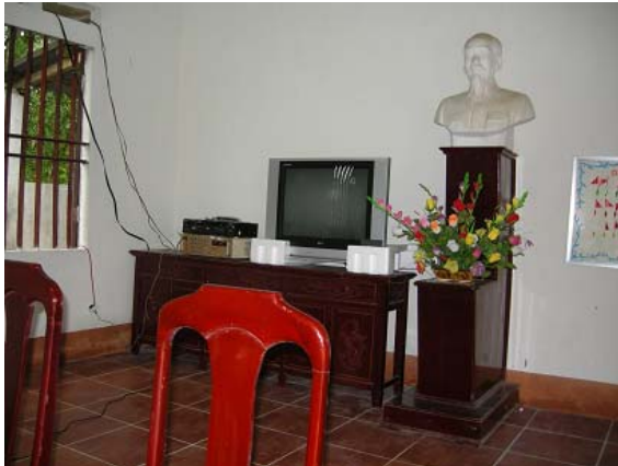
그림 23 마을회관 지원-TV, 앰프, 바닥타일 등