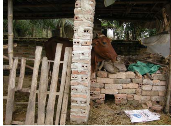
그림 16 소득개발 지원-우량소 입식