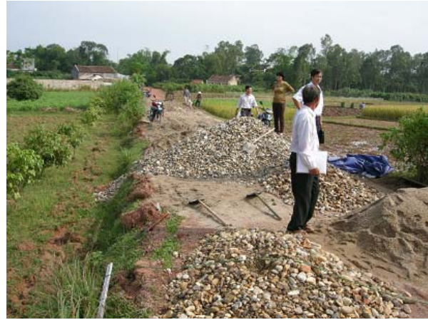
그림 6 인프라 지원-마을간도로 포장