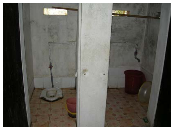
그림 26 생활환경 개선-화장실, 목욕실 복합