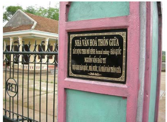
그림 24 마을회관 지원-담장("한국새마을운동모형")