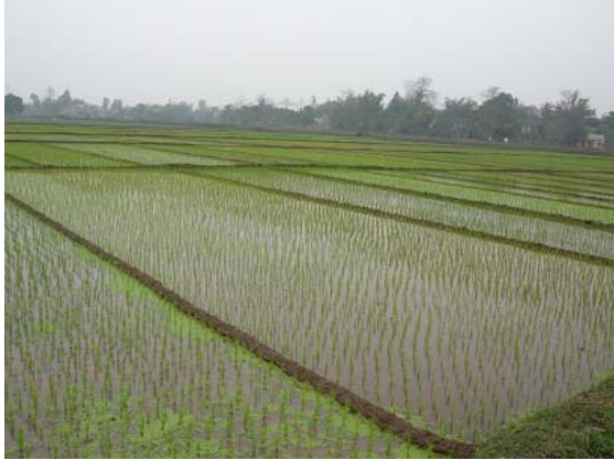
그림 15 소득개발 지원-벼