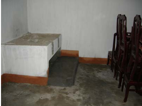
그림 21 마을회관 지원-부엌