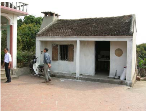
그림 11 생활환경 개선-부엌