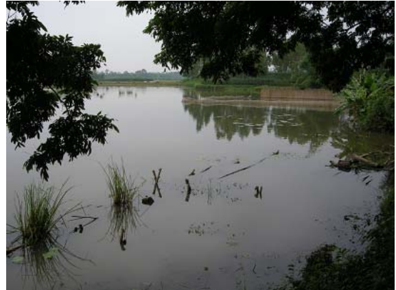
그림 18 소득개발 지원-양식장 조성부지