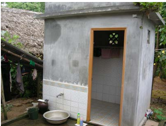
그림 25 생활환경 개선-목욕실