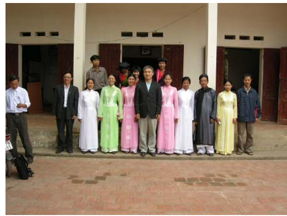
그림 10 마을회관 지원-전통의상