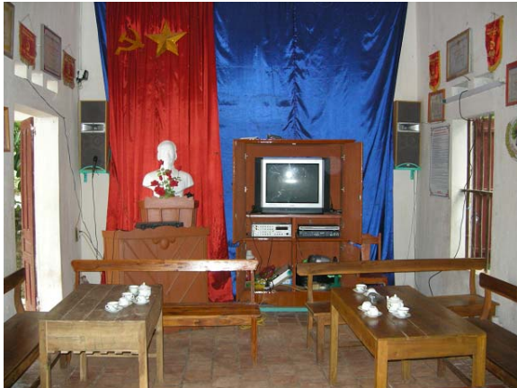
그림 7 마을회관 지원-TV, 앰프, 커튼 등