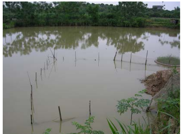
그림 4 소득개발 지원-양식장