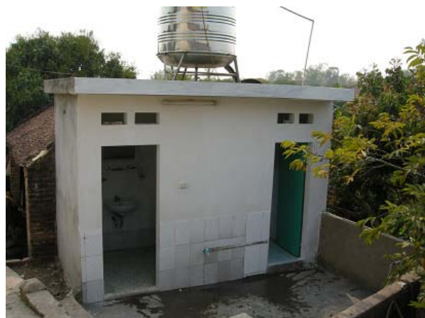
그림 12 생활환경 개선-화장실, 목욕실 복합