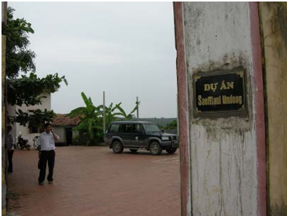
그림 13 마을회관 입구간판-“새마을운동 사업”