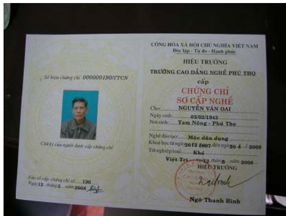
그림 19 소득개발 지원-목공교육