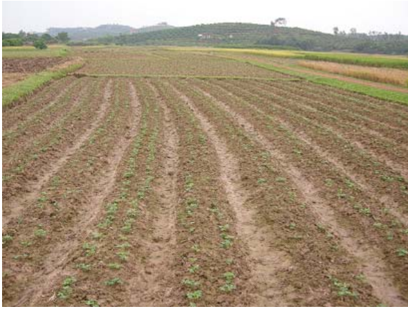
그림 1 소득개발 지원-땅콩