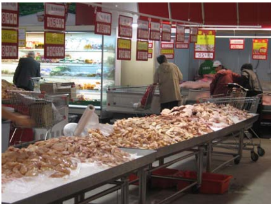
<매장내 닭고기 판매 모습>