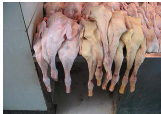
< 오리고기 판매장 >