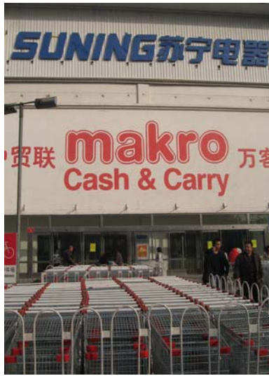
<대형 소매점(MAKRO) 방문>