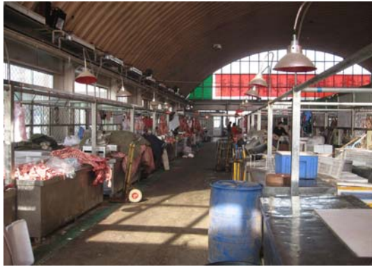
< 쇠고기 판매장 >