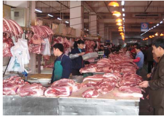
< 돼지고기 판매장 >