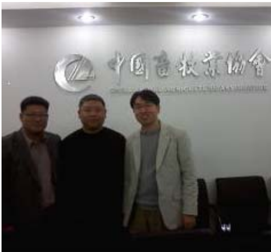
< 중국축목업협회 >