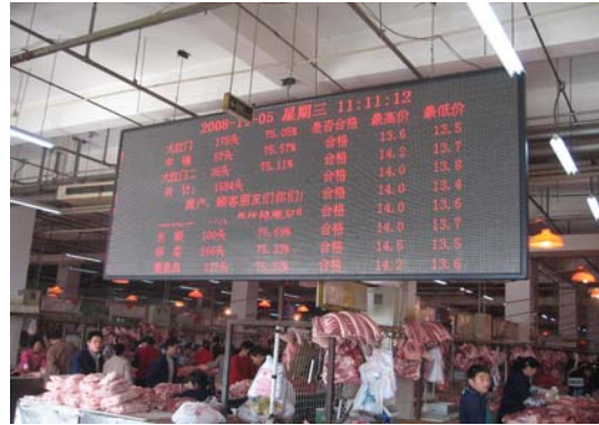
< 도매시장내 육류 경매 현황 >