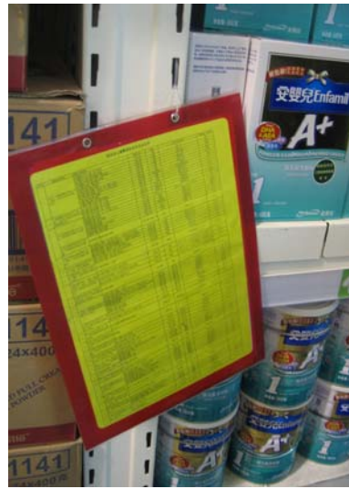
<멜라민 검출 분유 리스트>