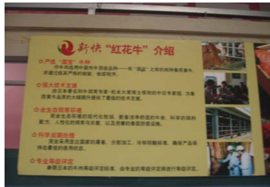
<브랜드 쇠고기(紅花牛) 판매 >