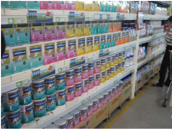
<매장내 분유 판매대 모습>