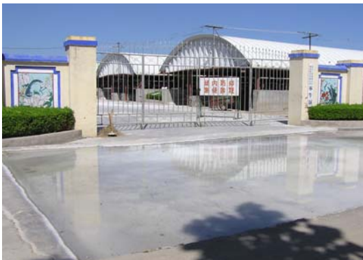
<주성 소 집단총공사>