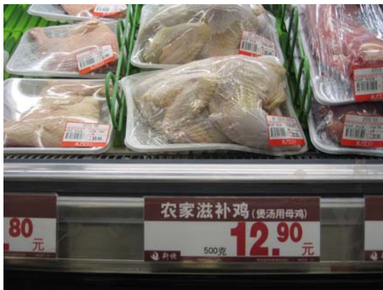
<매장내 닭고기 판매 모습>