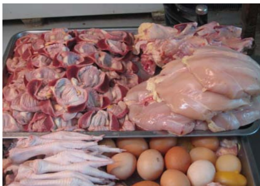
< 닭고기 및 부산물 판매장 >