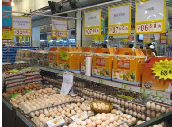
<매장내 계란 판매 모습>