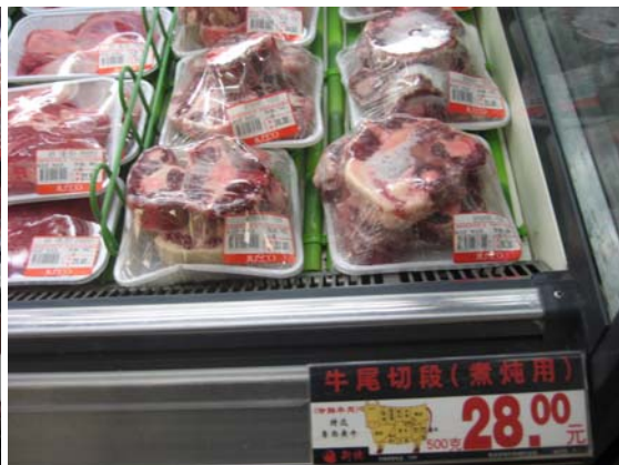
<매장내 쇠고기 판매 모습 >