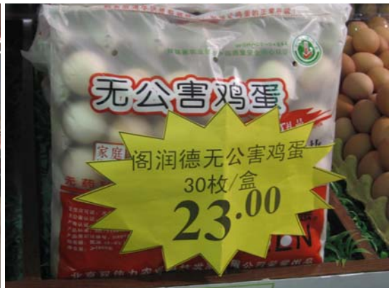
<유기농 무공해 계란 판매 모습>