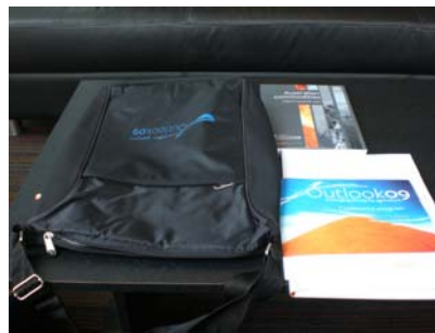
참가자 가방, 책자, 자료