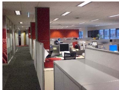
ABARE 사무실 전경