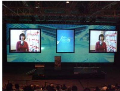
동영상 발표(USDA 연구자)