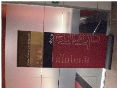
ABARE 사무실 입구