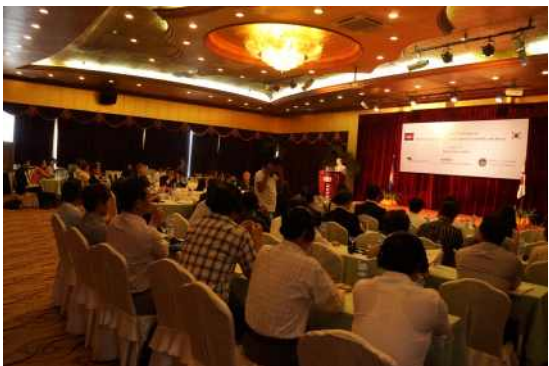
행사 진행 모습