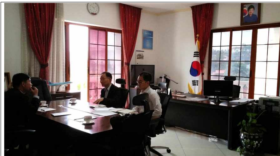
주 르완다 대사관 방문