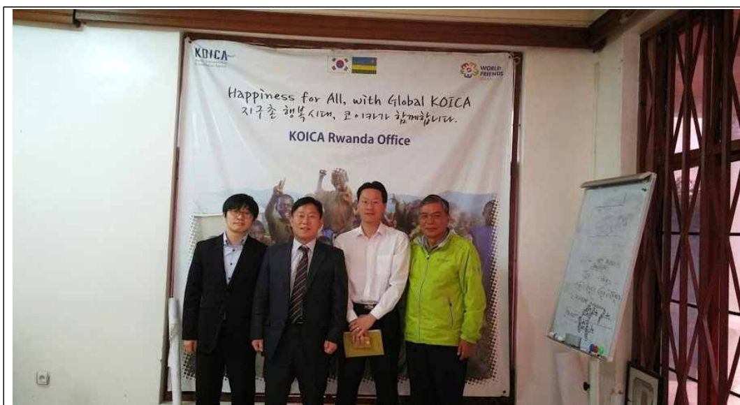
주 르완다 KOICA 사무소 방문