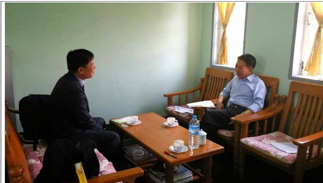
주 미얀마 KOPIA 사무소 방문