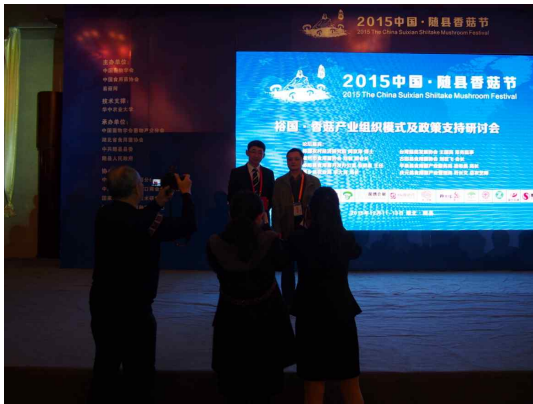
<주제발표 후 촬영>