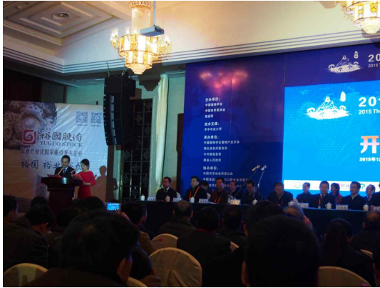
<행사 진행 장면>