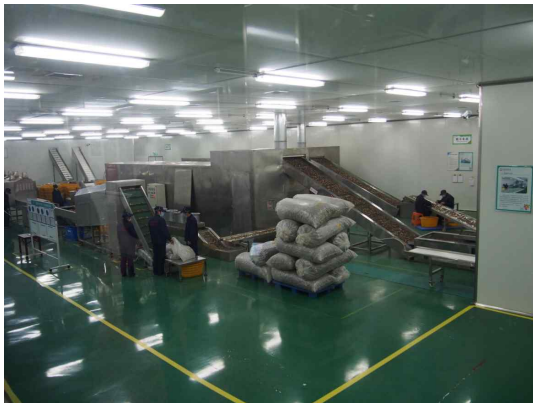
<표고버섯 선별과 포장>