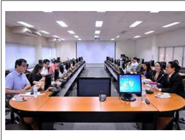
그림. 태국 CODEX 대응업무 조사 업무협의회 사진