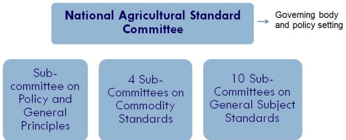
그림 3. 태국의 국가농업표준위원회 구성도