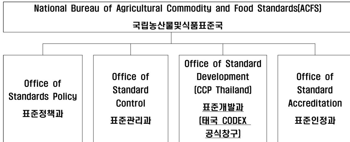
그림 2. ACFS 조직도