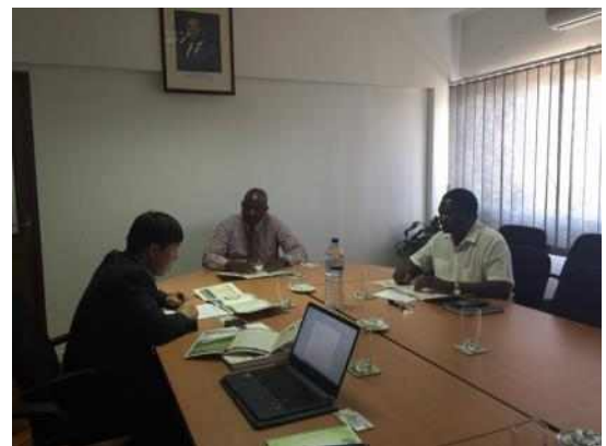
<농업기술지도국 관계자 면담>