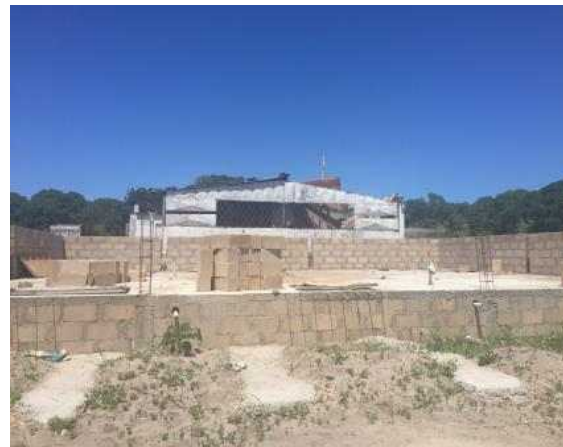
<영농교육센터 부대시설 증축 현장>