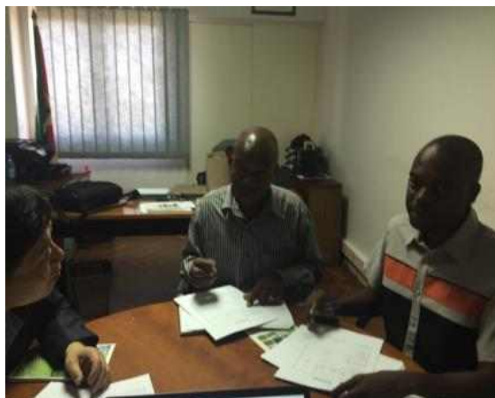
<KAPEX ACADEMY 지원자 인터뷰>